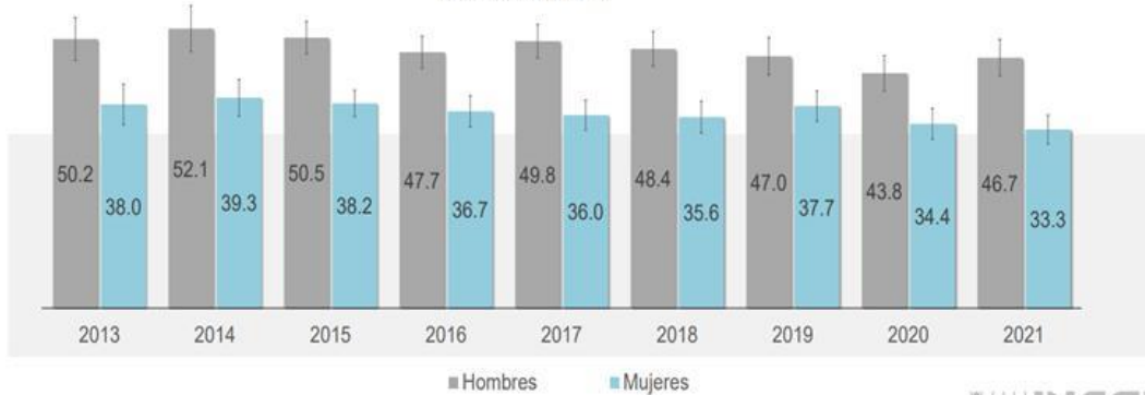
Porcentaje de la población de 18 y más años de edad activa físicamente, por sexo Serie 2013 a 2021

Nota: En cada barra se presenta la estimación por intervalo de confianza al 90 por ciento.